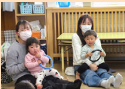
親子で楽しみました

4月18日(土)中島保育所において、保育参加が行われました。親子で歌や手遊び、シール貼りや指スタンプをするなど、いつもの保育所での過ごす様子を親子で楽しむことができました。