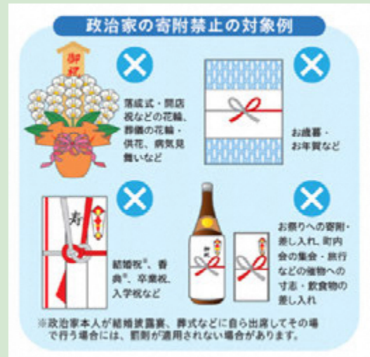
広報誌「総務省」(2025年12月号)より

政治家からの寄附は受け取らない！要求しない！ 明るい選挙のために「三ない運動」を徹底しましょう。