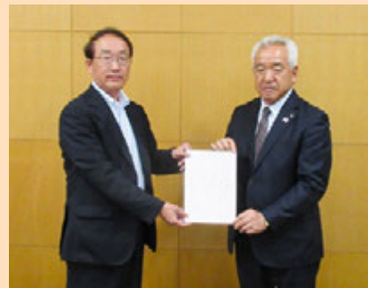
1年間、よろしくお願いいたします