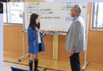
決意のことばを述べる小室さん▶