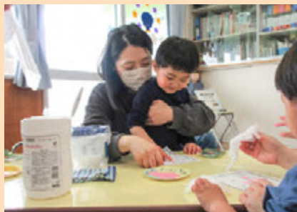
上手にシール貼り、指スタンプができました◎