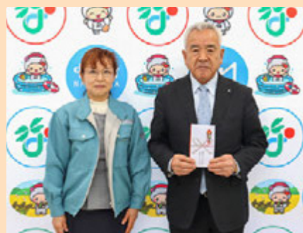
村政発展のため活用させていただきます