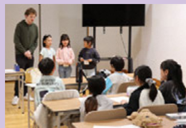
英語での自己紹介

4月21日(火)、輝ら里にて、第1回LEE(英会話)教室が開催されました。子どもの部では、メイソン先生から英語での自己紹介の仕方を学び、一人一人がロールプレイングで練習しました。大人の部では、自己紹介の後、アメリカと日本の文化の違いなどについて英語で楽しく交流しました。LEEは「Let's Enjoy English!」の略で、英語を楽しむことを大切にしたい教室です。