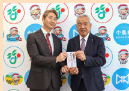
寄付を手渡す仲島専務取締役