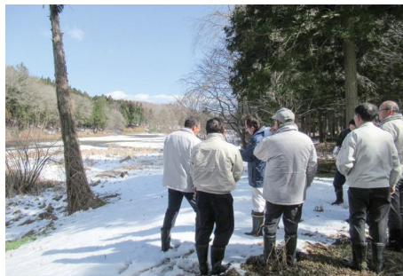
童里夢公園大池の工事予定地の視察

3月定例会期間中の3月5日に令和8年度当初予算の説明会を実施しました。説明会では各課より令和8年度の事業及び予算について説明を受けた後、現地調査を実施しました。