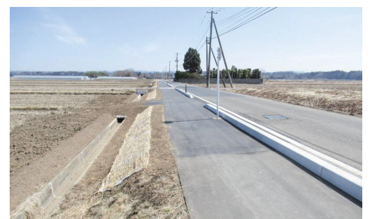
完成した二子塚町畑線歩道