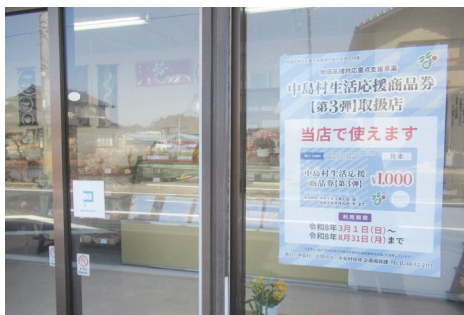
生活応援商品券のポスターが目印

・「中島村生活応援券」を配布し、3月1日から8月31日までの利用期間で開始しました。