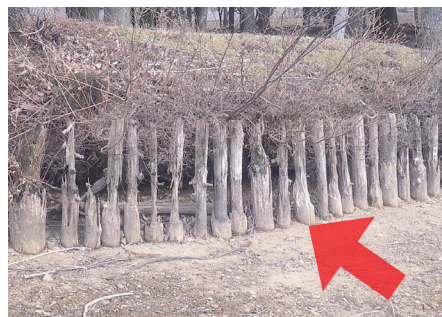
老朽化した土留め

童里夢公園内にある大池の土留めの老朽化が進んでいることから、修繕を行う事業です。