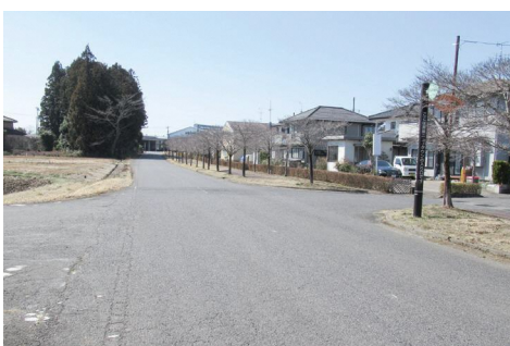
浦原ニュータウン前の区画線の様子

村民駐車場に面している道路から商工会の交差点、福祉センターからJA集荷場の交差点までの区画線の引き直しを予定しています。