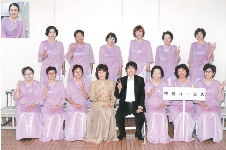
福島県おかあさん合唱祭に参加! (令和5年 10月)