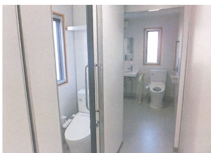
改修された吉子川小学校体育館トイレ