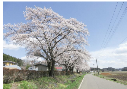
【道路側から見た喜四夫桜】