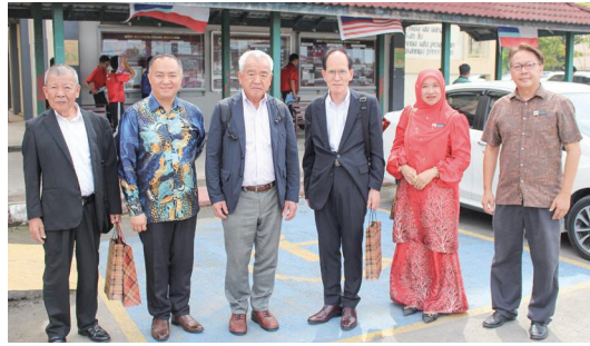
イナナムセカンダリースクールを訪問

また、併せて在コタキナバル領事事務所やサバ州観光局、イナナムセカンダリースクールを訪問しました。引き続き円滑な交流ができるように協力していきます。