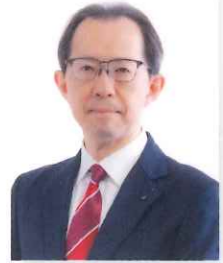
日本赤十字社福島県支部 支部長 内堀 雅雄

県民の皆さまには、日頃から日本赤十字社の活動に対し、温かいご支援を賜り心から感謝申し上げます。 昨年も大規模な山林火災や台風等による大雨、12月の青森県沖地震などにより、甚大な被害が全国各地で発生しました。日本赤十字社では、被災地での医療救護活動やこころのケア活動、救援物資の配付、義援金の受付など被災者支援に取り組んでまいりました。