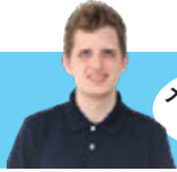
メイソン先生の 英語教室