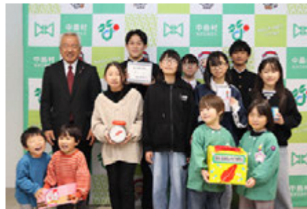
ご協力ありがとうございました

会長は、「みなさんの心のこもった募金を、困っている人に役立てます。ありがとうございます」と感謝の言葉を述べました。