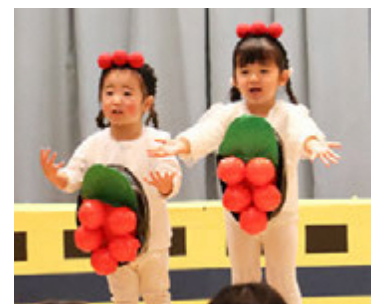
自分で着替えておすしに変身！