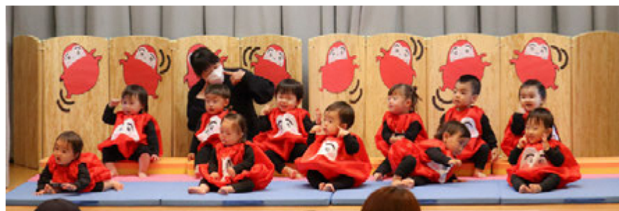
だるまさんのまねがとっても上手♪