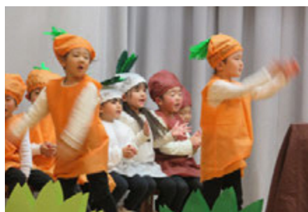
にんじん だいこん ごぼう(年少)

11月29日(土) 中島幼稚園において、子どもの国の発表会が行われました。練習してきたことを本番でお客様の方に披露し、たくさん拍手をいただきました。