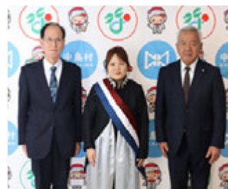
本番の衣装で交付式に参加してくださいました

大会は12月6日(土)～7日(日)に埼玉県さいたま市スーパースターで行われました。