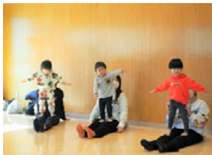
みんな上手に体を動かします！