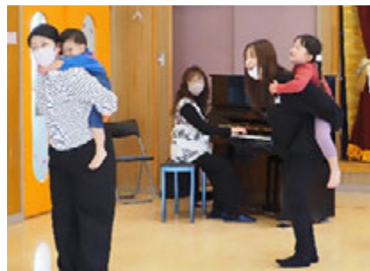
元気いっぱい活動しました♪

今回の育児講座は、年齢に合わせた三部構成で行われ、楽しく体を動かすことができ、笑い声が絶えない講座となりました。