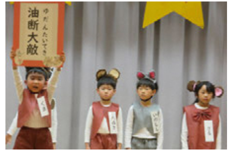
四字熟語カルタ（年長）