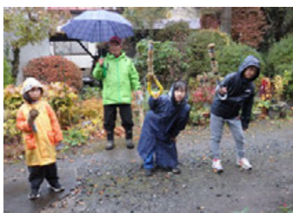
雨の中でのむじなぶちとなりました

むじなぶちには50名が参加し、「まいこんだ、まいこんだ、むじなぶちがまいこんだ、大麦、小麦、三角そばあたい」とかけ声をかけながら、約120軒まわりました。