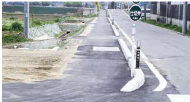
▶二子塚町畑線歩道設置工事