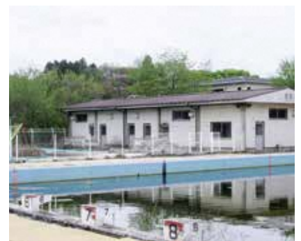
老朽化した改善センタープール管理棟