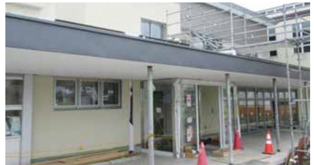
▶役場新庁舎建築工事躯体工