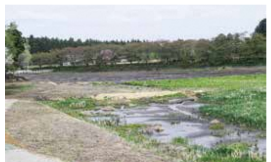
ため池浚渫工事予定地(童里夢公園内新池)

※簡易水道特別会計、農業集落排水処理事業特会計は、令和5年度より公営企業会計へ移行