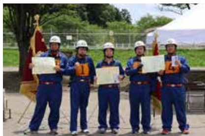
第2分団第2部 (二子塚)