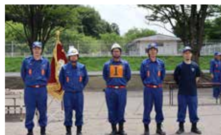
第2分団第3部 (川原田)