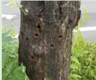
被害木には上のような脱出孔が見られる。