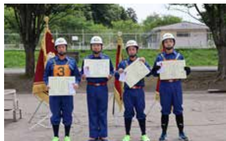
個人賞 (小型ポンプの部)