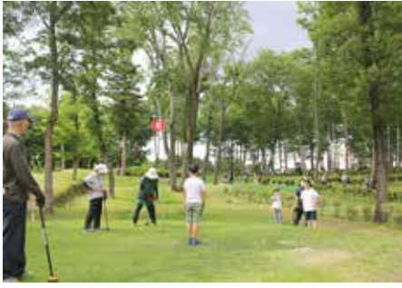
緑に囲まれたコースの中で交流を楽しむ参加者たち

クラウン大学今年度第3回講座は6月10日(土)、世代間交流事業が実施されました。今年は、泉崎村パークゴルフ場でパークゴルフ体験を行いました。クラウン大学生2人と子ども2人、計4人が一組となり、団体戦と個人戦を行いました。また、各組に1人ずつ、泉崎村パークゴルフ協会の方がついて、ルールや打ち方などを指導していただきました。 クラウン大学生にとっては、孫やひ孫に当たる子どもたちとの交流でしたが、和やかにプレーを楽しんでいました。