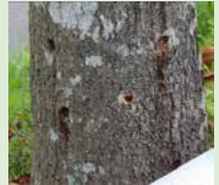
被害木には上のような産卵痕が見られる。