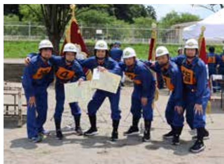
第1分団第1部（滑津原）