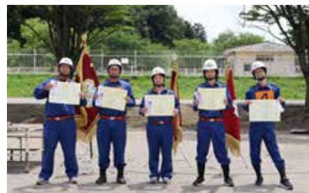
個人賞 (自動車ポンプの部)