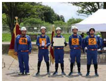
第1分団第3部（岡ノ内）